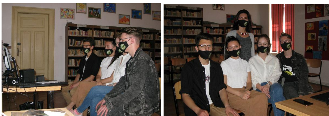
Sesiunea de pitch-uri, 7 iunie, 2021

Participarea la acest concurs a însemnat șansa de a forma o echipă, de a cunoaște și înțelege o mică parte din lumea afacerilor și totodată ne-a oferit acces la oameni cu afaceri de succes.